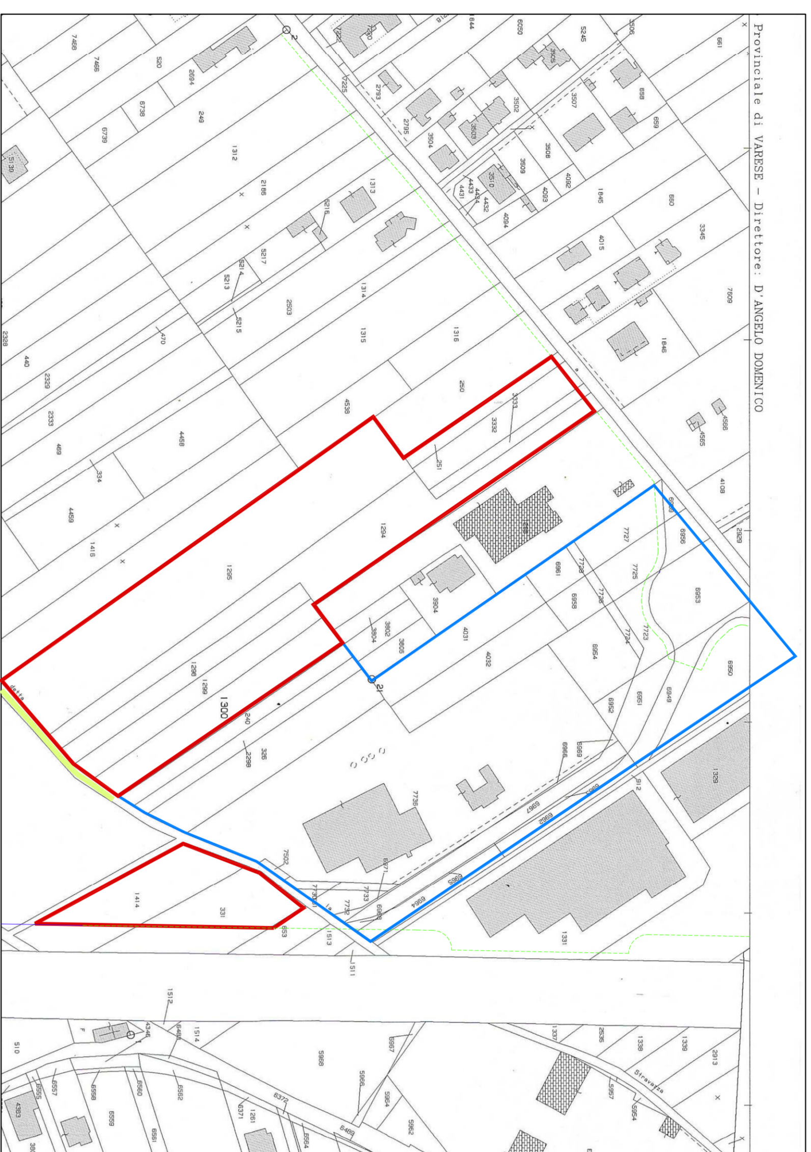
ESTRATTO DI MAPPA - scala 1:2000 Fg.10 mapp. 1294, 1295, 1298, 1299, 1300, 331, 1414, 251, 3332, 3333

Individuazione PL 26 in corso di attuazione Individuazione aree oggetto d'intervento Tratto strada consorziale dello Stravazzo da riqualificare